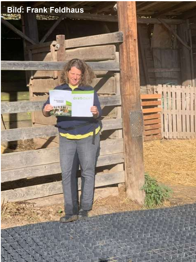
Der Herbst zeigte sich kurz von seiner schönen Seite